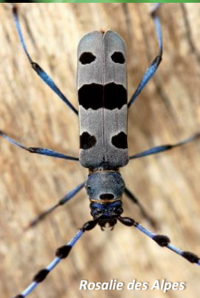
Rosalie des Alpes