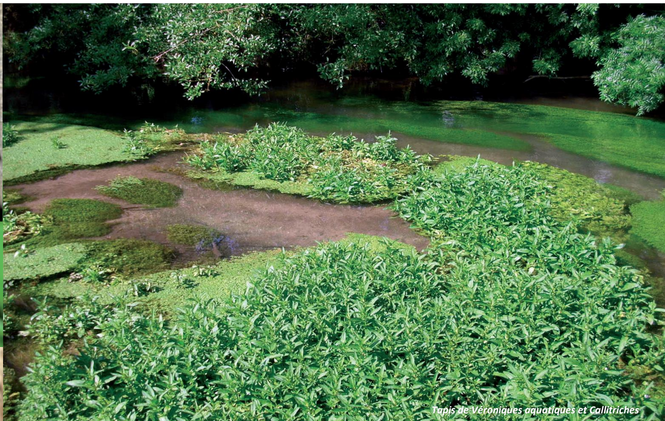
Tapis de Véroniques aquatiques et Callitriches