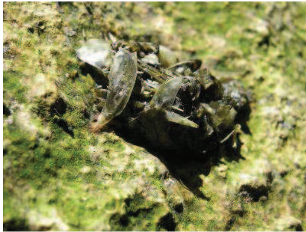
Epreinte de Loutre observée sur le site Natura 2000