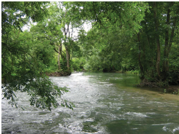
Ripisylve et cours d'eau de bonne qualité et parcelles adjacentes présentant un couvert végétal important

Cependant des collisions ont été notées sur la commune de Périgné à la jonction de la D740 et de la Belle. Des aménagements sont nécessaires à ce niveau.