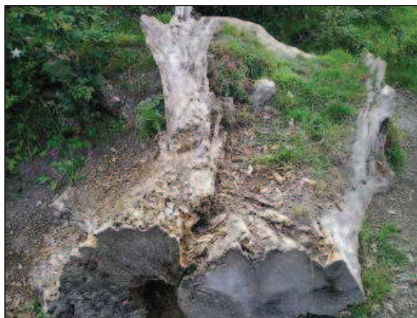
Souches sur pied favorables au Lucane